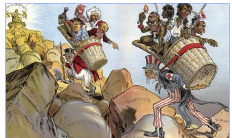
〈빅터 길럼, 「백인의 짐」〉