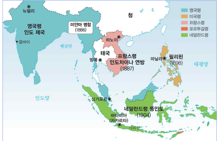
<열강의 인도, 동남아시아 식민 지배>