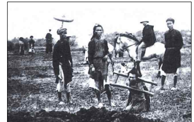
<프랑스의 인도차이나 착취>